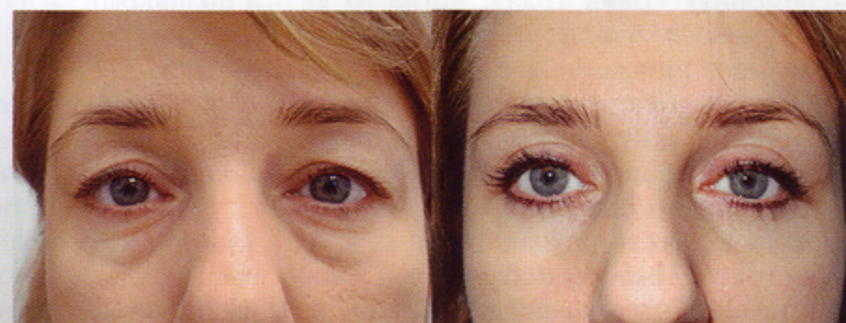
Трансконъюнктивальная лазерная блефаропластика