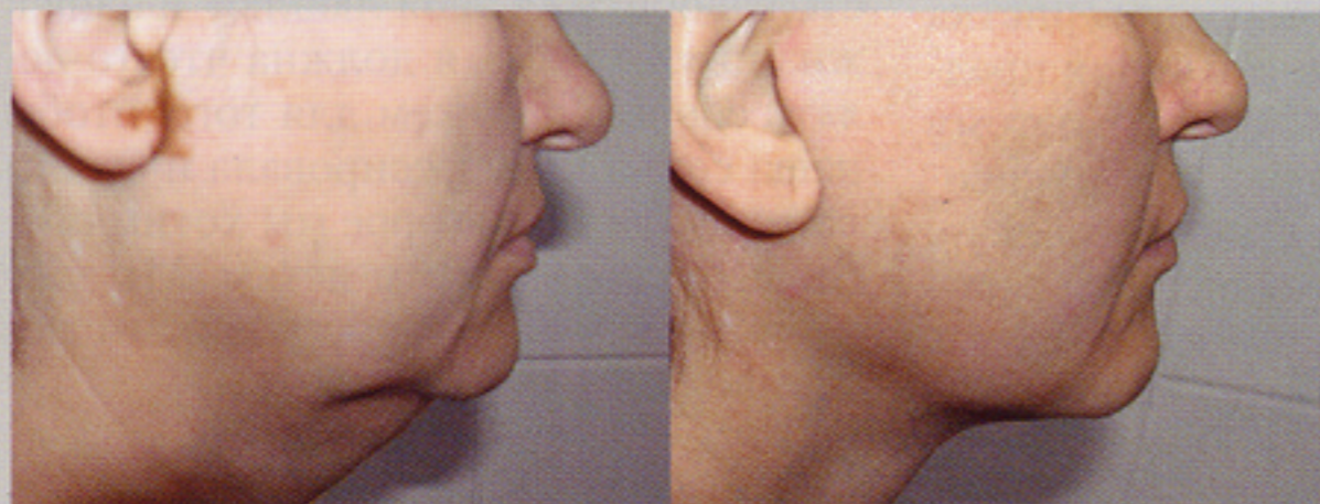
Двухволновой лазерный липолиз подбородка